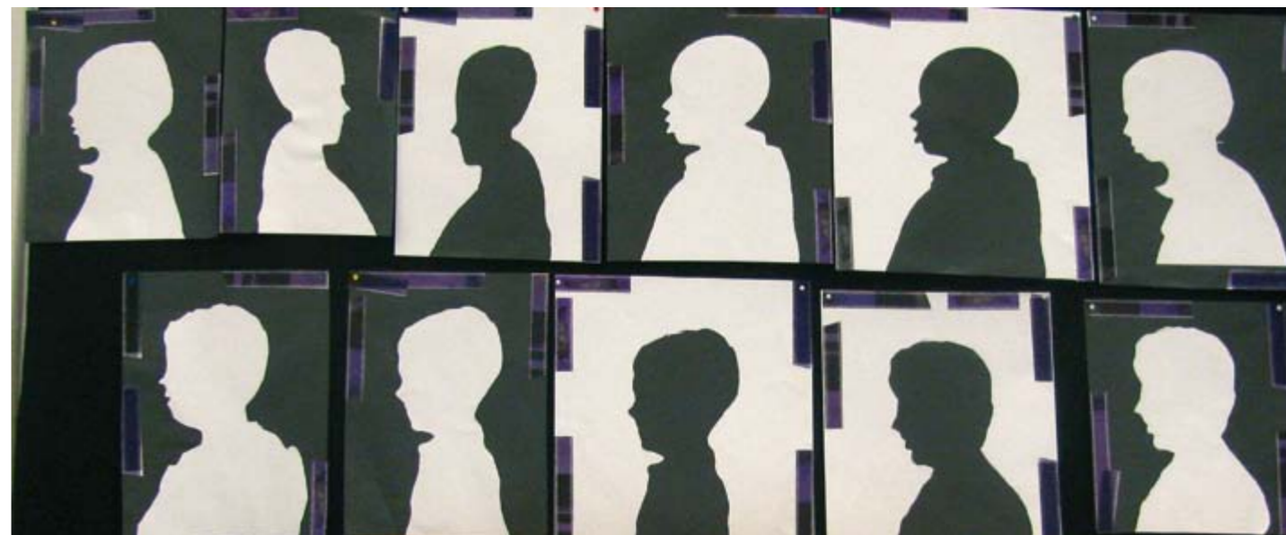
Le négatif et le positif