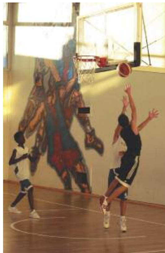
Les minimes masculins à l'entraînement

Tourné vers l'avenir, le club vient de mettre en place une nouvelle activité, créée pour les filles et garçons de moins de 6 ans: le baby basket. Cette activité leur permet de découvrir le basket et plus généralement le sport collectif et ses valeurs, au travers de jeux ludiques et pédagogiques. Les séances ont lieu le samedi matin de 10h à 12h, à partir du 25 septembre. Au delà de l'aspect sportif, le club de basket de Lingolsheim se veut être un lieu d'échanges et de convivialité où joueurs, parents et amis, se