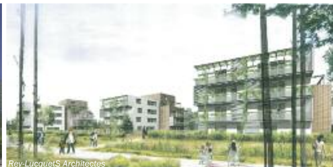
Ci-dessus : le projet rue du Travail