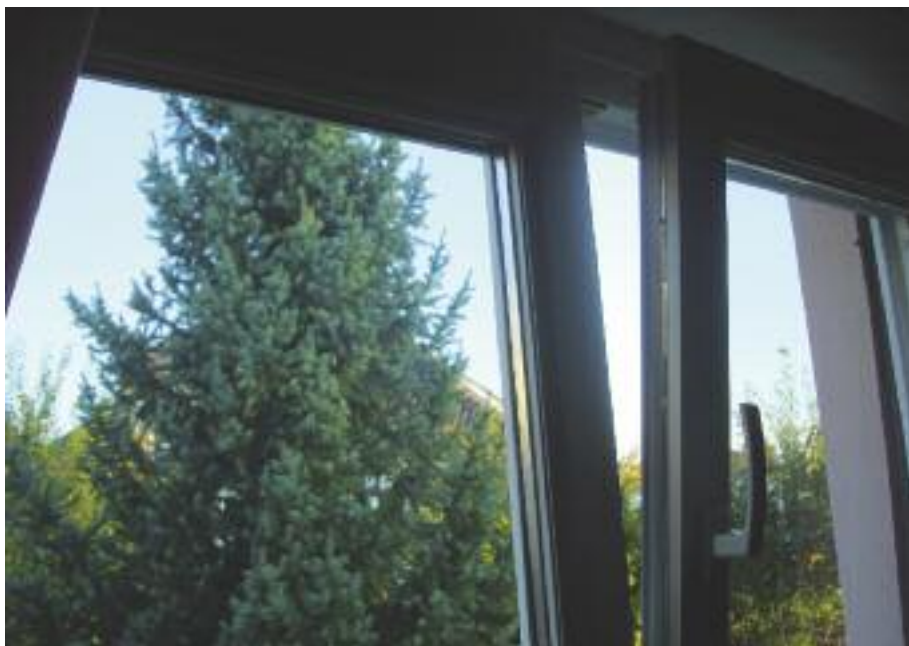
Il est important d'aérer un logement quotidiennement