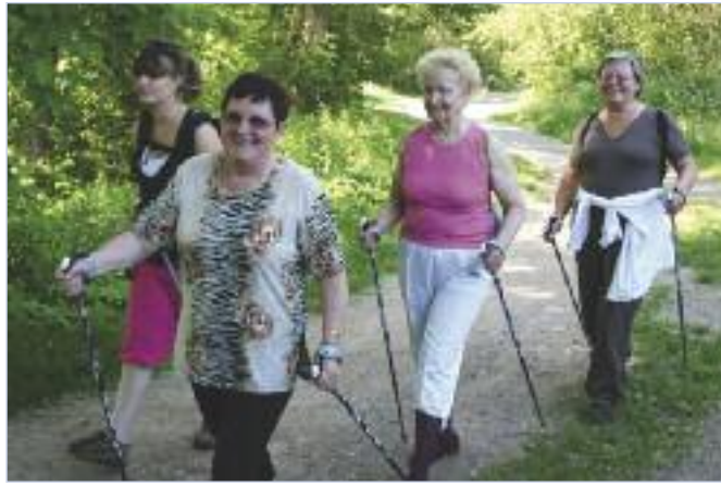
De la marche nordique au Parcours de santé