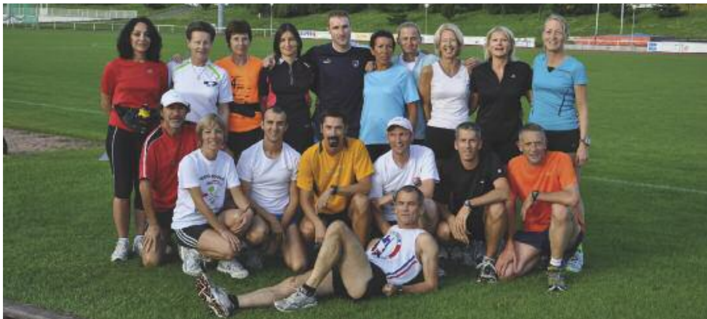
Une vingtaine de coureurs de l'IBAL iront au marathon de Berlin