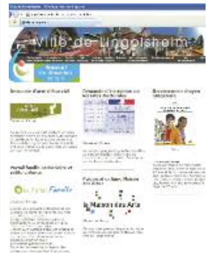
La ville développe l'e-administration