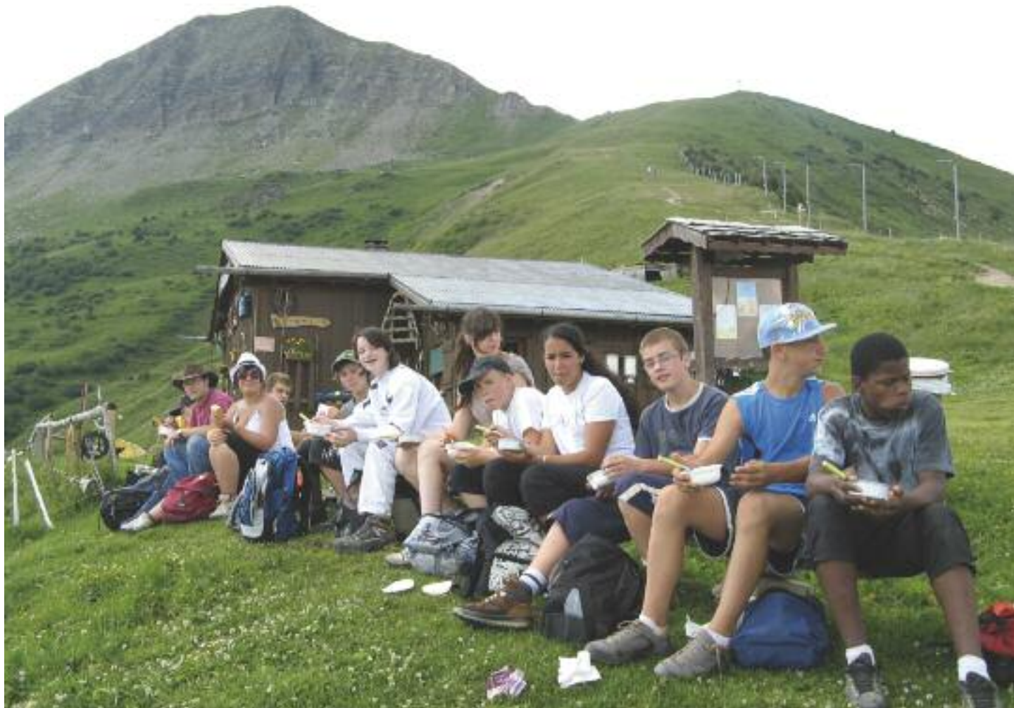
Pique-nique à mi-parcours dans l'ascension du mont Joly

Cette été, les ados de l'Albatros ont parcouru quelques 3800 km à travers le Grand Est, le Bad Wurtemberg et la Haute-Savoie.